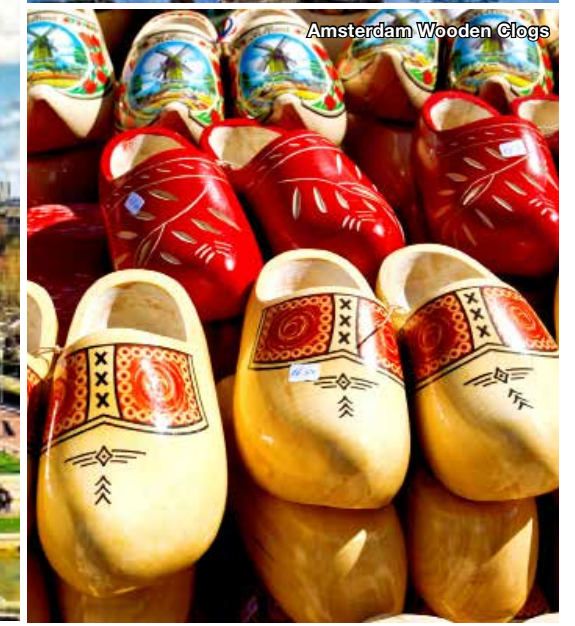
Amsterdam Wooden Clogs