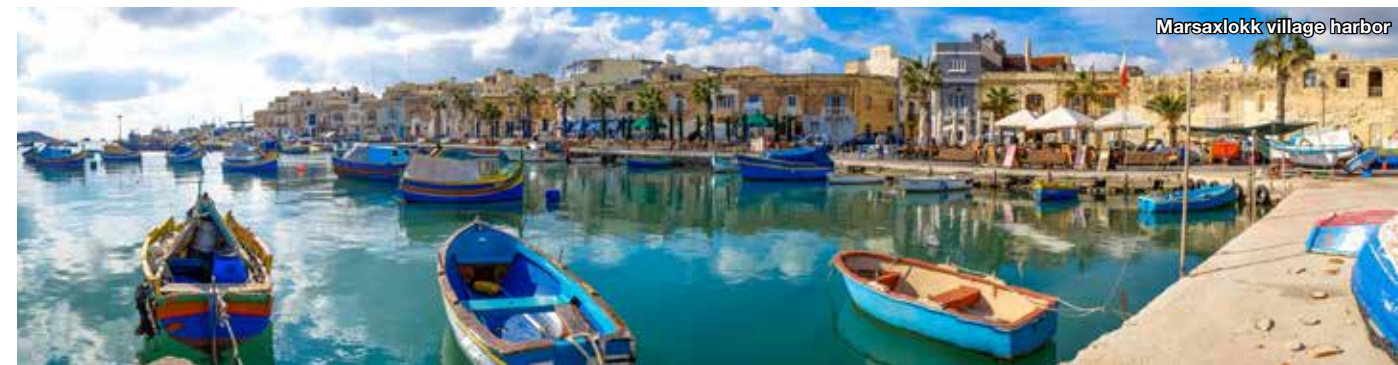
Marsaxlokk village harbor