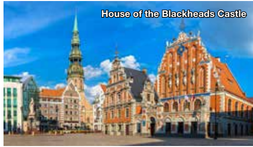
House of the Blackheads Castle

Hari ini Anda telah tiba kembali di Jakarta yang merupakan akhir dari perjalanan tour bersama AVIA TOUR . Semoga perjalanan ini membawa kesan manis untuk Anda. Terima kasih atas partisipasi Anda dan sampai jumpa pada acara tour lainnya.