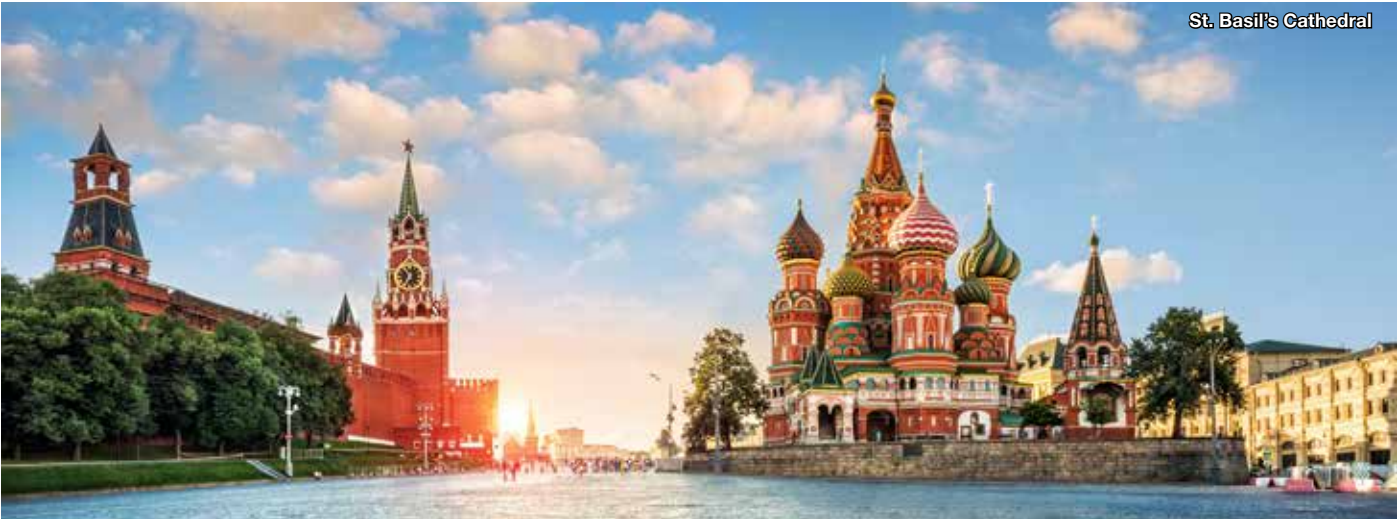
St. Basil's Cathedral