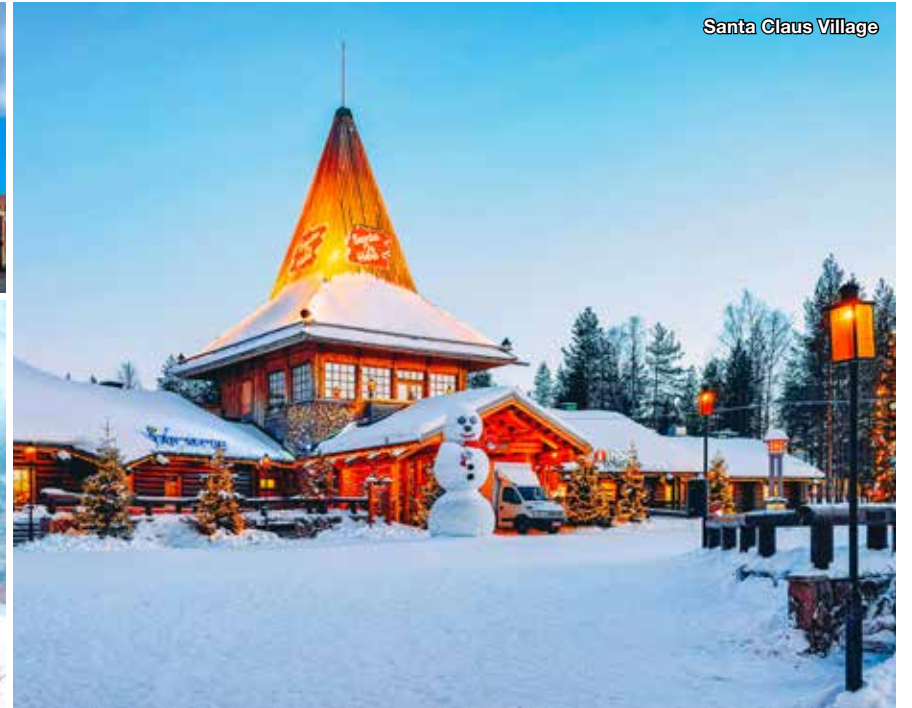
Santa Claus Village