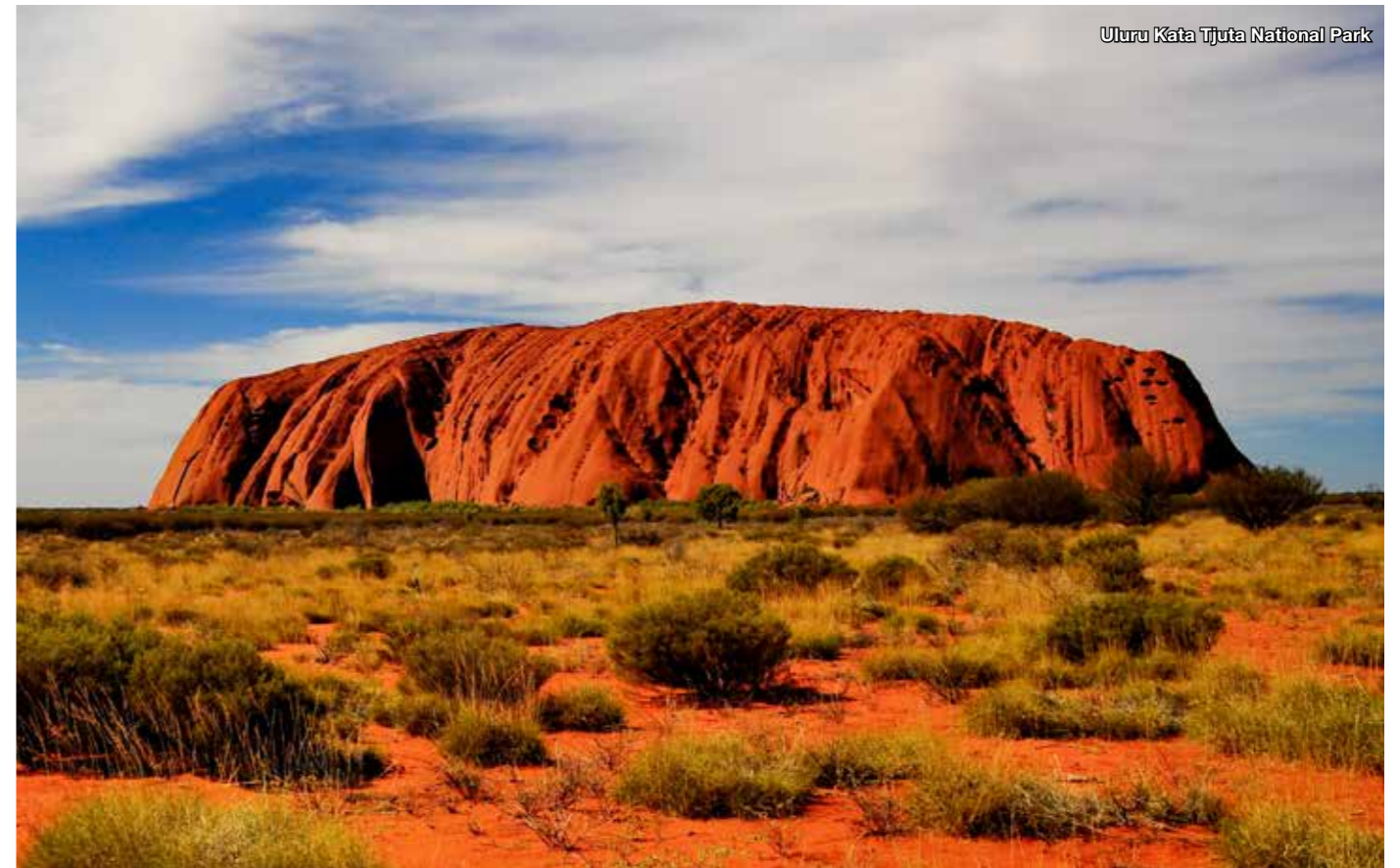
Uluru Kata Tjuta National Park