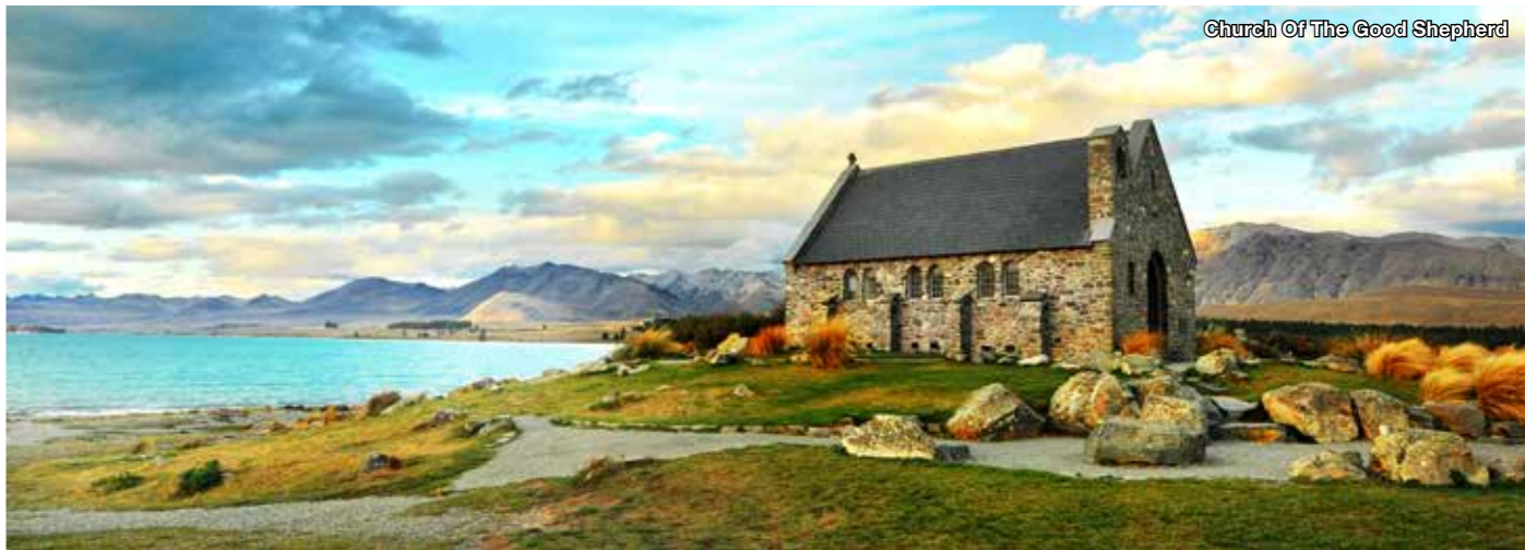
Church Of The Good Shepherd

For Further Details Visit : www.avia.travel